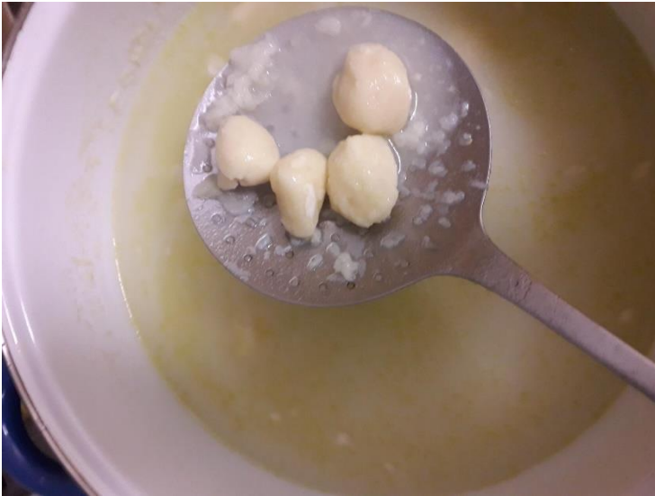
La sortie du bain