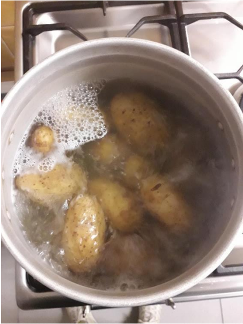
La cuisson des pommes de terre