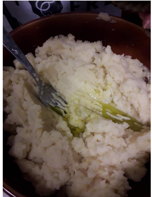
Ecrasé de pommes de terre + huile + oeuf