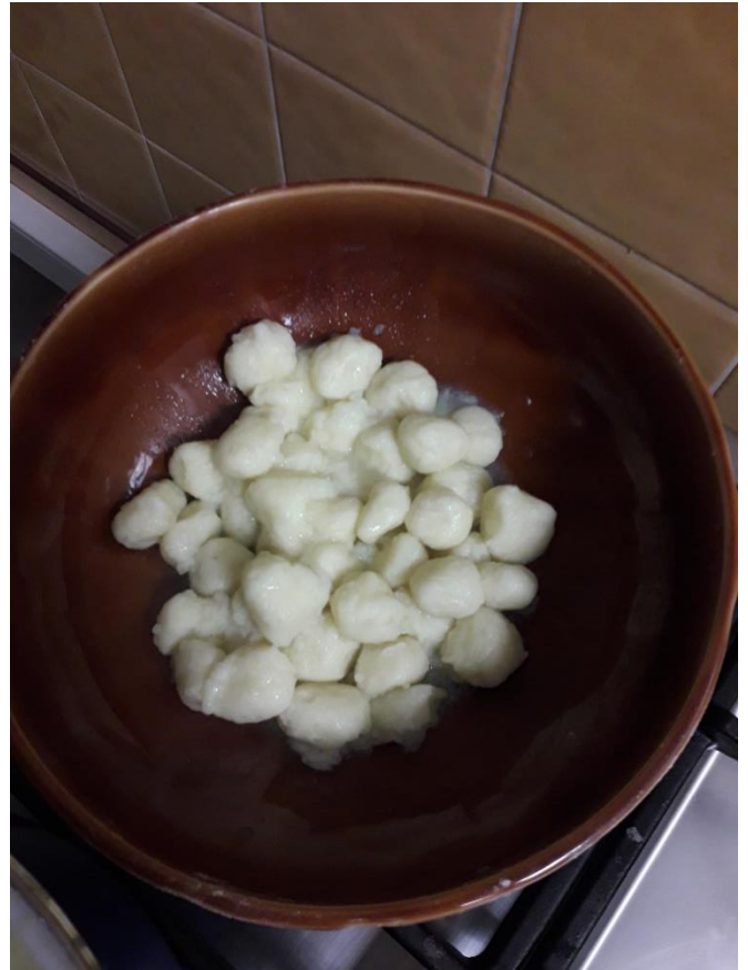
Prêts à déguster !