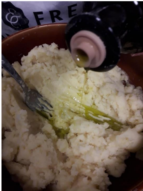
Ecrasé de pommes de terre